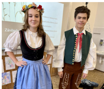
V duchu předvánoční atmosféry