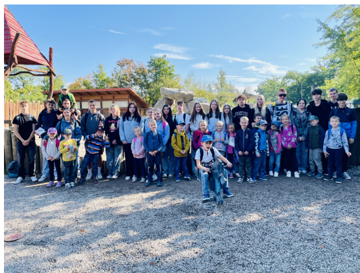
1.B a 9.B v ZOO Hluboká

Hlavní prázdniny trvají od 28. 6. 2025 do 31. 8. 2025.